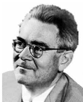
Hans Reichenbach (1891-1953)