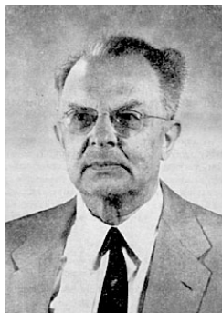
Rudolf Carnap (1891-1970)