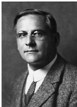
Moritz Schlick (1882-1936)